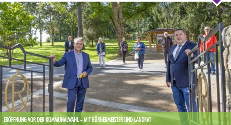
ERÖFFNUNG VOR DER KOMMUNALWAHL – MIT BÜRGERMEISTER UND LANDRAT