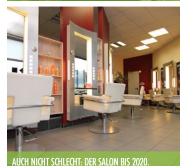
AUCH NICHT SCHLECHT: DER SALON BIS 2020.