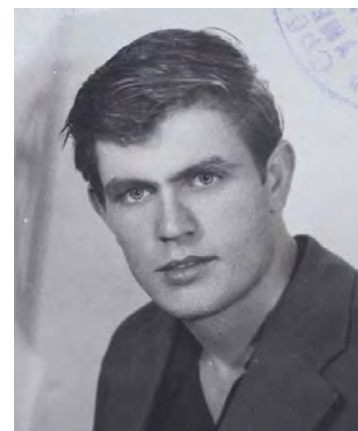
NEU AN DER AKADEMIE IN BELGRAD (1961)

Wenn kein Gefühl dabei ist, dann ist es gutes Handwerk, aber keine Kunst. Goethe sagte mal: Wenn du einen Mops ganz genau abmalst, dann hast du zwei Möpse, aber kein Kunstwerk.