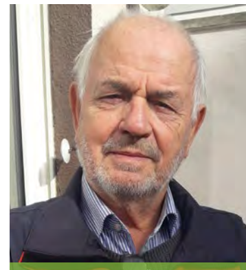
REDZEP HEUTE: NOCH IMMER KÜNSTLER UND SAMMLER

Der große POLSTER-SPEZIALIST aus Bad Salzungen!