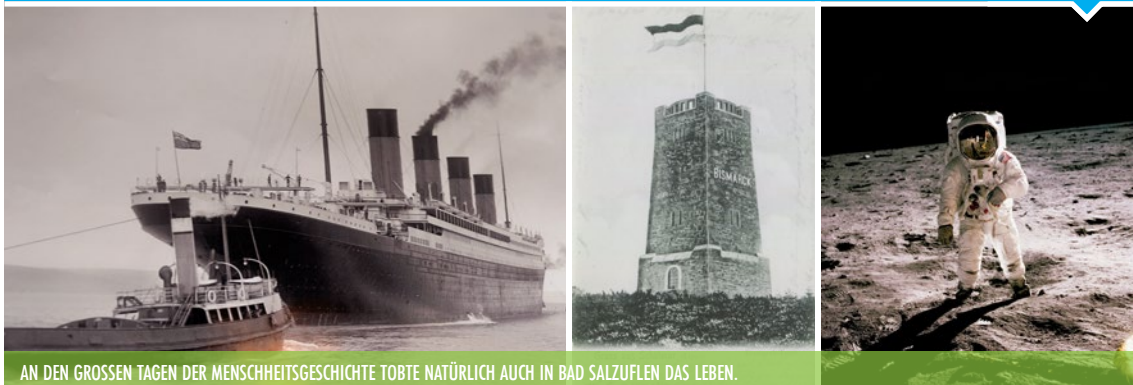
AN DEN GROSSEN TAGEN DER MENSCHHEITSGESCHICHTE TOBTE NATÜRLICH AUCH IN BAD SALZUFLEN DAS LEBEN.