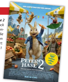
Peter Hase 2 Regie: Will Gluck Animation / Abenteuer / Familie 93 Minuten Kinostart: 01.07.2021