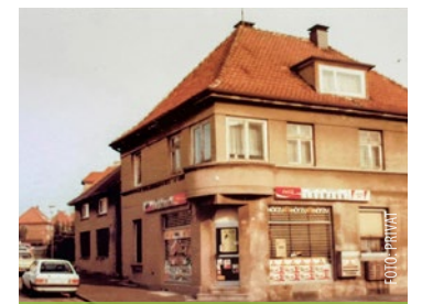
ALLES DRIN, ALLES DRAN: ANFANG DER ACHTZIGER.