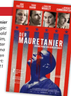
Der Mauretanier Regie: Kevin Macdonald Mit Tahar Rahim, Jodie Foster Thriller / Drama 130 Minuten Kinostart: 01.07.2021