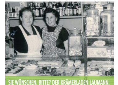
SIE WÜNSCHEN, BITTE? DER KRÄMERLADEN LAUMANN.