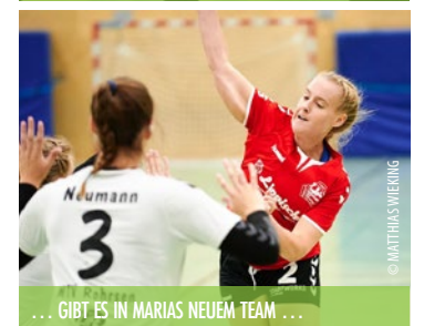
... GIBT ES IN MARIAS NEUEM TEAM ...