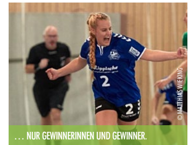
... NUR GEWINNERINNEN UND GEWINNER.