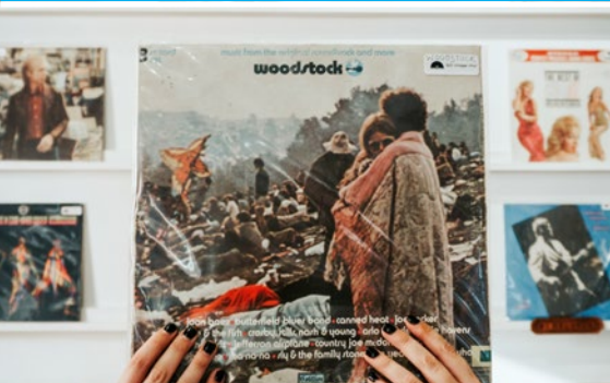
LOVE, PEACE, HAPPINESS UND EINE REVOLUTION DER POPMUSIK. AUF DEN GROSSEN BÜHNEN DER WELT UND ZEITGLEICH AUCH IN BAD SALZUFFLEN.