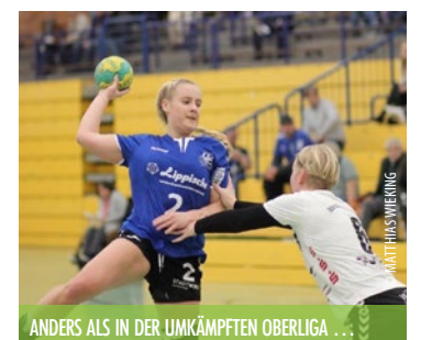
ANDERS ALS IN DER UMKÄMPFTEN OBERLIGA ...

Unter der Adresse gluecksteam@handball-bad-salzuflen.de kann man uns anschreiben. Wir melden uns dann umgehend zurück.