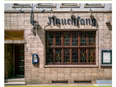
HIER GEHTS LANG! DER EINGANG VOM RAUCHFANG.