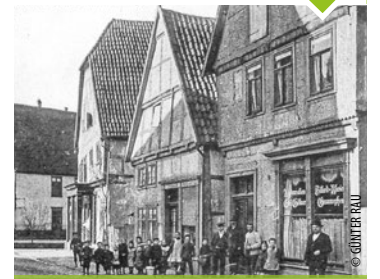
DAS RESTAURANT EMIL GÖLLNER UM 1910.