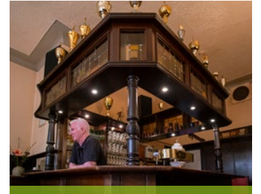
ECHTE KNEIPENKULTUR MIT RETRO-CHARME.