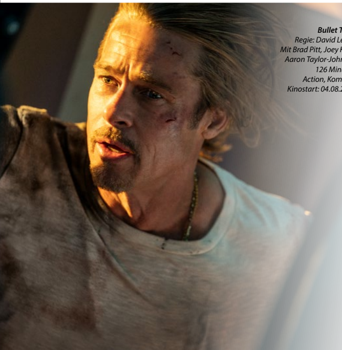
Bullet Train Regie: David Leitch Mit Brad Pitt, Joey King, Aaron Taylor-Johnson 126 Minuten Action, Komödie Kinostart: 04.08.2022