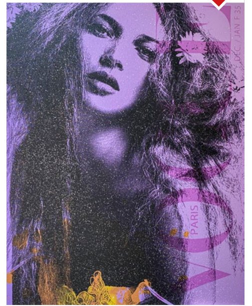
Kate Moss – H.-Jürgen Kuhl, Pigmentdruck mit Diamond Dust auf Leinwand, 80 cm x 100 cm,

Die Gesamtauflage des Motivs Kate Moss hat der Künstler auf insgesamt zehn Exemplare limitiert. Jedes Original wurde selbstverständlich von H.-Jürgen Kuhl handsigniert.