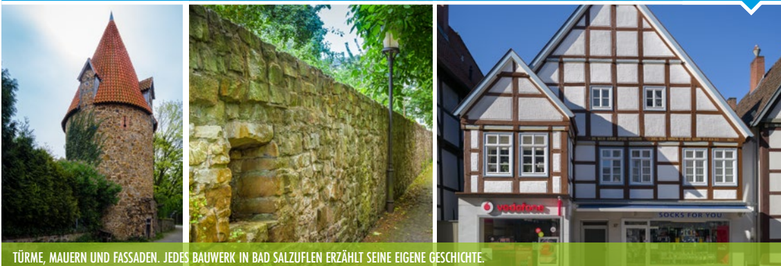
TÜRME, MAUERN UND FASSADEN. JEDES BAUWERK IN BAD SALZUFEN ERZÄHLT SEINE EIGENE GESCHICHTE.